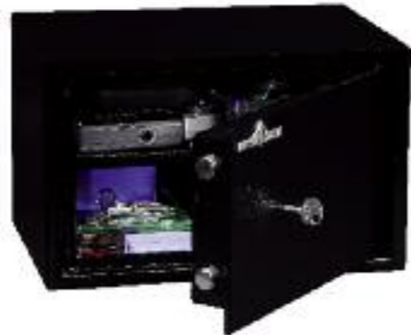
HT 15. 1 tablette réglable en hauteur au pas de 40 mm.

CONSTRUCTION EN ACIER 1 ER CHOIX, STRUCTURE INDÉFORMABLE ET MONOBLOC EN ACIER DE 30/10 E . PORTE INARRACHABLE SANS GONDS APPARENTS, À DOUBLE PAROI ÉPAISSEUR TOTALE 40 MM DONT 60/10 E EN ACIER. OUVERTURE À 90°. TROUS DE SCELLEMENT (2 DANS LE DOS, 2 À LA BASE). FINITION PEINTURE ÉPOXY (POUDRE) CUITE AU FOUR À 180°, COLORIS NOIR RAL 9005.