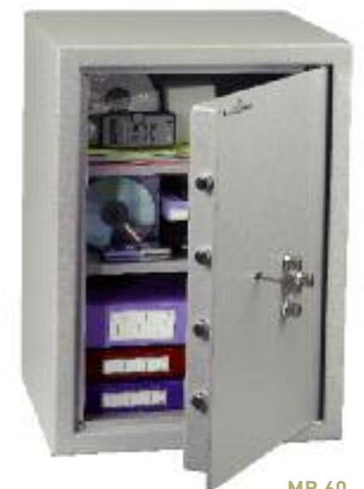
MB 60. 2 tablettes réglables en hauteur au pas de 40 mm.