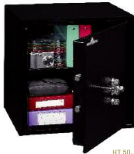
HT 50. 1 tablette réglable en hauteur au pas de 40 mm.