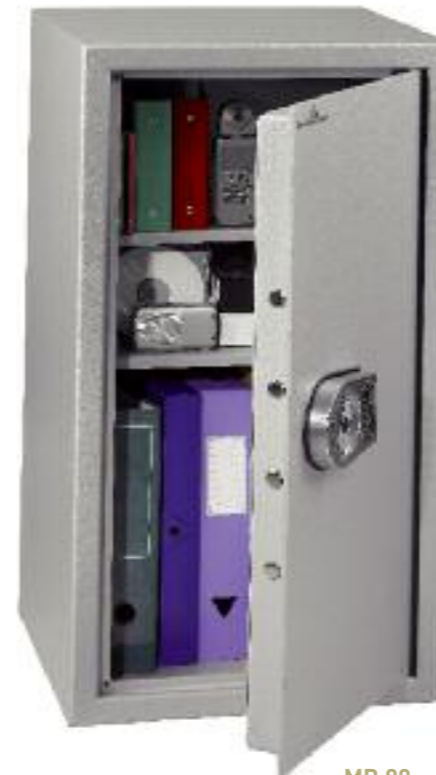
MB 80. 2 tablettes réglables en hauteur au pas de 40 mm.

CONSTRUCTION EN DOUBLE PAROI, STRUCTURE INDÉFORMABLE ET MONOBLOC. PORTE INARRACHABLE SANS GONDS APPARENTS, OUVERTURE À 90°. PERÇAGES POUR FIXATIONS (2 DANS LE DOS, 2 À LA BASE Ø 10 MM). FINITION PEINTURE ÉPOXY (POUDRE) CUITE AU FOUR, COULEUR GRIS CLAIR RAL 9006.