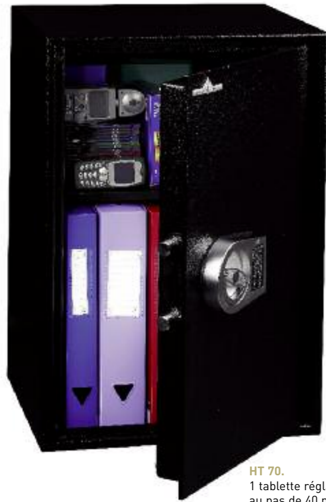
HT 70. 1 tablette réglable en hauteur au pas de 40 mm.

Blindage anti-perçage au manganèse du système de condamnation.