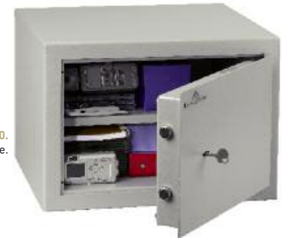
MB 30. 1 tablette amovible.