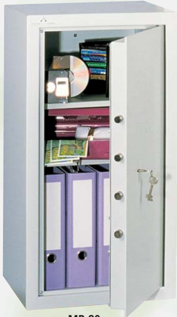
MB 80 2 TABLETTES REGLABLES EN HAUTEUR AU PAS DE 40 mm.

Dans un coffre sans isolant, la température s'élève très rapidement lors d'un incendie. Avec les coffres série MB, vos documents seront mieux protégés. La performance des matériaux ignifuges aux normes DIN 4102 ralentit considérablement la montée de la température interne.