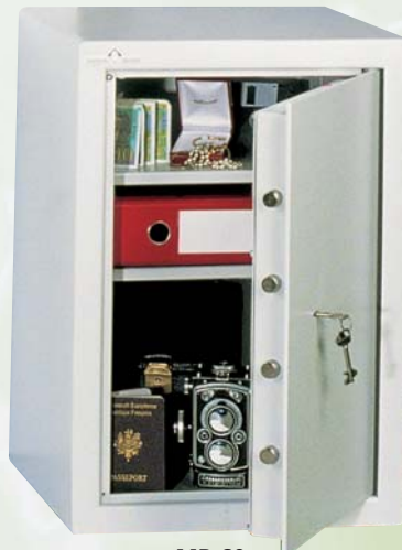
MB 60 2 TABLETTES REGLABLES EN HAUTEUR AU PAS DE 40 mm.