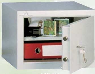
MB 30 1 TABLETTE AMOVIBLE.