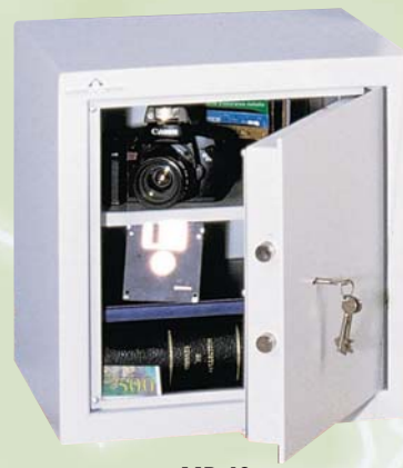
MB 40 1 TABLETTE REGLABLE EN HAUTEUR AU PAS DE 40 mm.