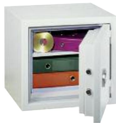
Protect Fire 50. Équipement standard, 1 tablette réglable sur crémaillères au pas de 40 mm.