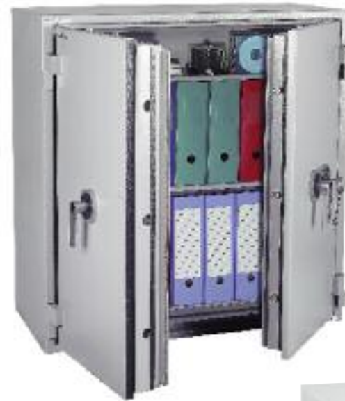
Protect Fire 246. Avec 2 tablettes réglables sur crémaillères au pas de 40 mm.