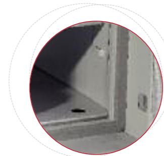
Joint multiples pour assurer l'étanchéité lors d'un incendie.