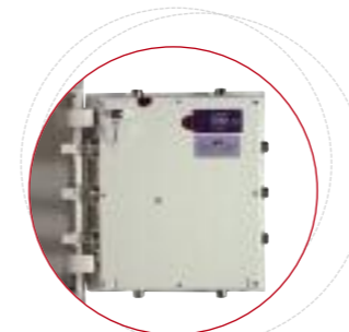
Verrouillage de la porte sur les 4 côtés par pènes tournants actifs/passifs chromés, nickelés, anti-sciage. Angle d'ouverture porte 200°.

Fabrication Nouvelles Technologies Baisse de poids de 30%