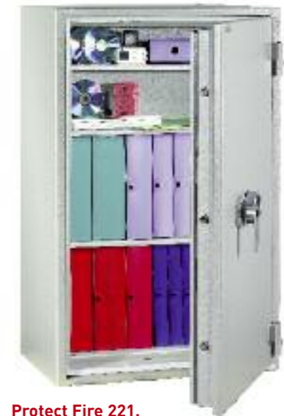
Protect Fire 221. Avec 3 tablettes réglables sur crémaillères au pas de 40 mm.

Fabrication Nouvelles Technologies Baisse de poids de 30%