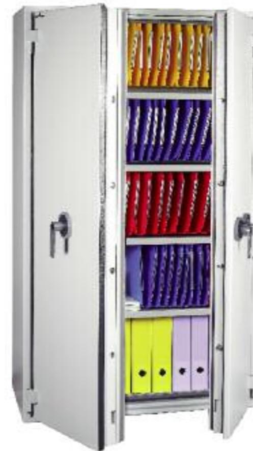
Protect Fire 710. Avec 4 tablettes pour dossiers suspendus réglables en hauteur + 1 rail d'accrochage dans le haut (5 niveaux de dossiers suspendus au total).