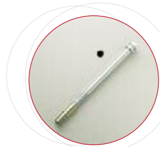
Trou de scellement à la base ø 14 mm.